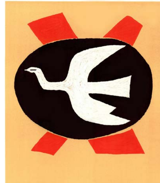
Illustration: L'oiseau de feu

Ekonomikum, hörsal 3 Kyrkogårdsgatan 10, Uppsala Lördagen den 10 februari 2018 Klockan 10:00 – c:a 16:30. Registrering sker från klockan 09:15